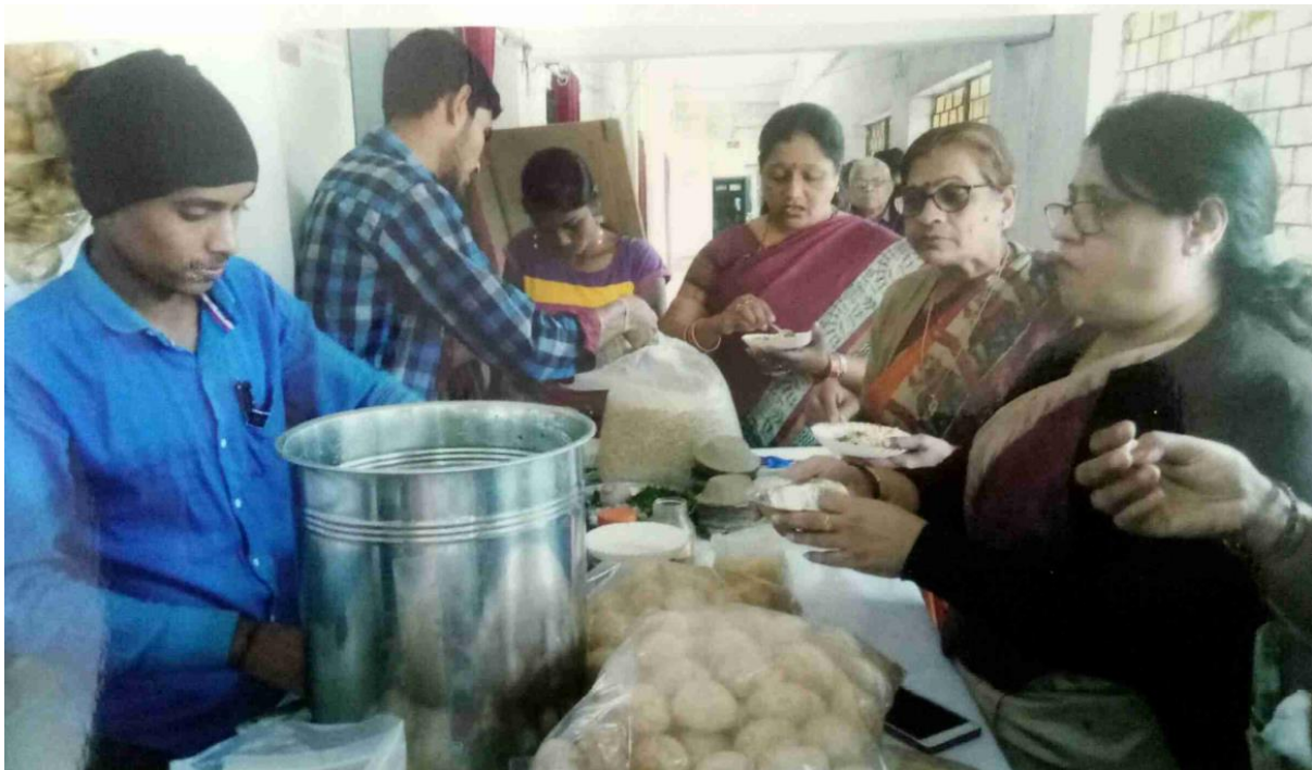
Students of Department of English selling food Items at EAC Camp: January 2019.