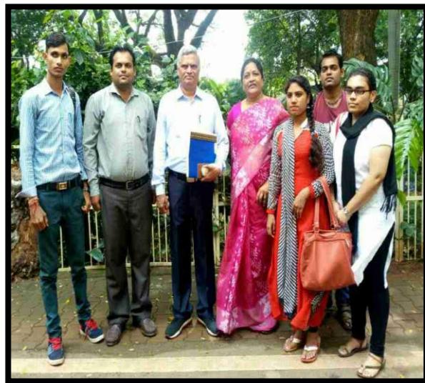
Kalyan College visit September 2018 for academic purpose: Department of English